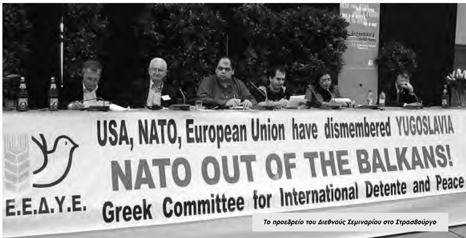
Το προεδρείο του Διεθνούς Σεμιναρίου στο Στρασβούργο

Την προηγούμενη μέρα της διαδήλωσης πραγματοποιήθηκε το σεμινάριο του Παγκόσμιου Συμβουλίου Ειρήνης για τα 60 χρόνια των εγκλημάτων του NATO, αλλά και τα 10 χρόνια απ' τον ιμπεριαλιστικό πόλεμο ενάντια στη Γιουγκοσλαβία. Εκπρόσωποι κινήματων ειρήνης απ' όλο τον κόσμο έφεραν εμπειρία απ' τη δράση του NATO στις χώρες τους. Κεντρικοί ομιλητές ήταν η Σοκόρο Γκόμες , πρόεδρος του ΠΣΕ, ο Θανάσης Παφίλης , γενικός γραμματέας του ΠΣΕ, ο Ζιβαντίν Γιובάνοβιτς , πρώην υπουργός Εξωτερικών της Γιουγκοσλαβίας, και ο Ντιάγκο Βιέρα , πρόεδρος της Παγκόσμιας Ομοσπονδίας Δημοκρατικών Νεολαίων. ▲