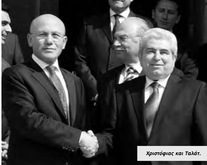
Χριστόφιας και Ταλάτ.

προσπλωμένοι στην εξεύρεση μιας λύσης διζωνικής – δικαιοδικής Ομοσπονδίας που θα κατοχυρώνει τις βασικές ελευθερίες και τα ανθρώπινα δικαιώματα ολόκληρου του λαού μας, Ε/κυπρίων και Τ/κυπρίων, καθώς επίσης και την πολιτική ισότητα των δύο κοινοτήτων.