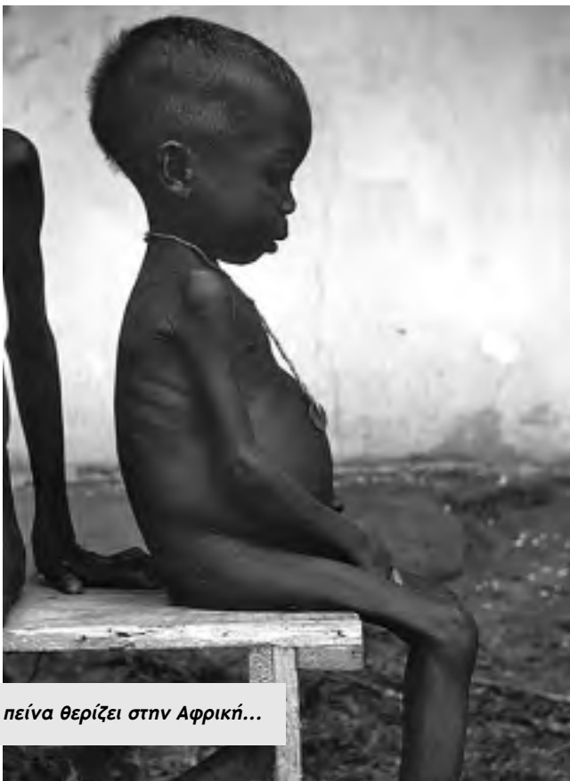
Η πείνα θερίζει στην Αφρική...

Η πραγματικότητα αυτή δεν βολεύει τους απολογητές του καπιταλισμού. Για να την εξωραΐσουν, επικαλούνται την πρόοδο στις καπιταλιστικές χώρες για να συσκοτίσουν