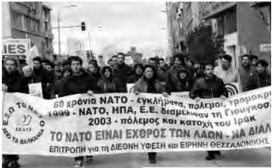
Από τις κινητοποιήσεις στην Αθήνα και στη Θεσσαλονίκη, αντίστοιχα.

Παρά τη βροχή, το δυνατό αέρα και το τσουχτερό κρύο, ο φιλειρηνικός λαός της Θεσσαλονίκης ανταποκρίθηκε στο κάλεσμα της Επιτροπής για τη Διεθνή Υφεση και Ειρήνη (ΕΔΥΕΘ) και συμμετείχε μαζικά στη συγκέντρωση, που έγινε έξω από την κεντρική πύλη του Λιμανιού, αλλά και στην πορεία που ακολούθησε μέχρι το αμερικάνικο Προξενείο το Σάββατο 21 Μάρτη .