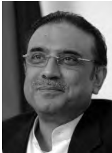
Αριστερά, ο Αζίφ Ζαρντάρι, πρόεδρος του Πακιστάν. Κάτω, ο πρωθυπουργός Γιουσούφ Ράζα Γκιλάνι, ο οποίος κήρυξε ευρείας κλίμακας πόλεμο κατά των Ταλιμπάν.

Στις αρχές Μαΐου και ενώ ο πρόεδρος του Πακιστάν, Αζίφ Ζαρντάρι, επισκεπτόταν τις ΗΠΑ για να συναντηθεί με τον αμερικανό πρόεδρο και τον πρόεδρο του Αφγανιστάν, ο πρωθυπουργός του Πακιστάν, Γιουσούφ Ράζα Γκιλάνι, κήρυξε ευρείας κλίμακας πόλεμο κατά των Ταλιμπάν. Η επίθεση του πακιστανικού στρατού βασίστηκε κατά το αμερικάνικο πρότυπο σε σφοδρούς βομβαρδισμούς από βαρύ πυροβολικό και αεροσκάφη σε κατοικημένες και μη περιοχές και στην συνέχεια χερσαίες επιχειρήσεις. Περισσότεροι από 2,5 εκατομμύρια έγιναν πρόσφυγες, ισοπεδώθηκαν ολόκληρα χωριά, καταστράφηκαν