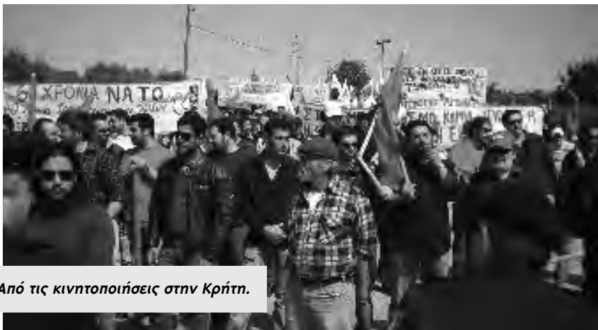
Από τις κινητοποιήσεις στην Κρήτη.

νερ τις εισόδους, ώστε να προστατέψει το ΝΑΤΟϊκό πλοίο, που εκείνη τη μέρα κατέπλευσε στο λιμάνι.