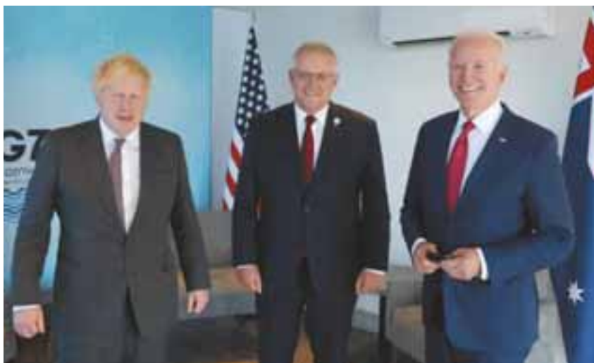
Από δεξιά προς τα αριστερά, ο Αμερικανός πρόεδρος Τζο Μπάιντεν, στη μέση ο Αυστραλός πρωθυπουργός Σκοτ Μόρισον και αριστερά ο Βρετανός ομόλογός του Μπόρις Τζόνσον.

Ας επανέλθουμε όμως στην AUKUS. Η συμφωνία αυτή, η οποία δεν περιλαμβάνει επί του παρόντος συγκεκριμένο άρθρο για τη συλλογική ασφαλεία, όπως το άρθρο 5 του NATO, (αν και αναμένεται να περιληφθεί στο τρέχον 16μηνο), δεν επιδιώκει μόνο τη στρατιωτική θωράκιση της Α-