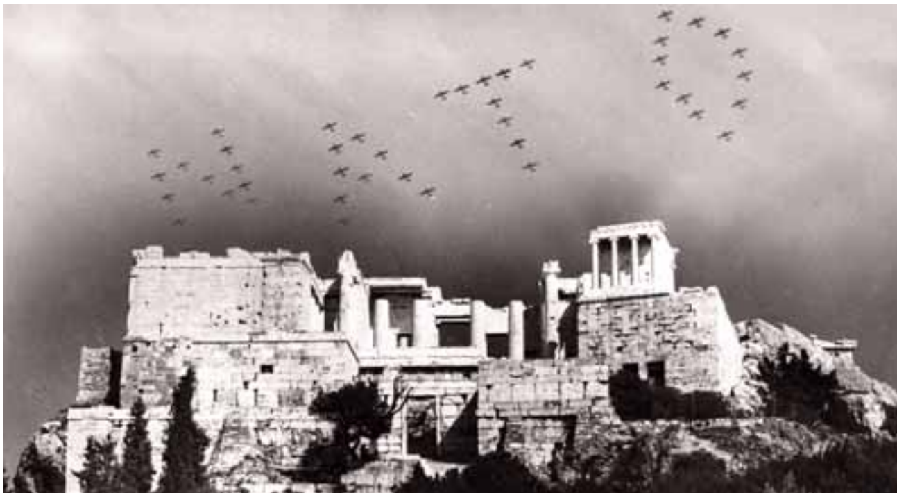
Αεροπλάνα σχηματίζουν τη λέξη NATO σε πτήση πάνω από την Ακρόπολη (Μάιος 1962), καλωσορίζοντας τη συνάντηση στην Αθήνα υπουργών Εξωτερικών και Άμυνας χωρών μελών του NATO.

Έφτασαν ντυμένοι «φίλοι» αμέτρητες φορές οι εχθροί μου τα παμπάλαια δώρα προσφέροντας. Και το δώρα τους άλλα δεν ήτανε παρά μόνο σίδηρο και φωτιά. Οδυσσέας Ελύτης