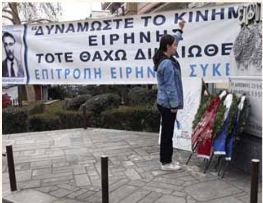
Η θυσία του Νίκου Νικηφορίδη φωτίζει και σήμερα τους αγώνες της νεολαίας.

επίθεση ενάντια στα δικαιώματα του λαού και της νέας γενιάς, που επιστρατεύει κάθε μέρα τους κατασταλτικούς της μηχανισμούς για να τρομοκρατήσει και να πατάξει τη λαϊκή αντίδραση, την ανυπακοή και την αν-