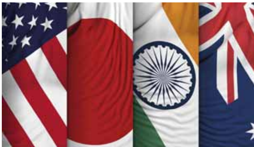
ΗΠΑ, Ιαπωνία, Ινδία και Αυστραλία είναι οι χώρες του QUAD.

στραλίας με τουλάχιστον οκτώ πυρηνικά υποβρύχια (γεγονός που φανερώνει μεσοπρόθεσμα σχέδια κλιμάκωσης των στρατιωτικών επιχειρήσεων σε πολύ μεγαλύτερη ακτίνα δράσης από εκείνη την οποία έχει σήμερα το αυστραλιανό πολεμικό ναυτικό), αλλά και αποκαλύπτει τη διάθεση για ευρύτερη αντιπαράθεση με την Κίνα.