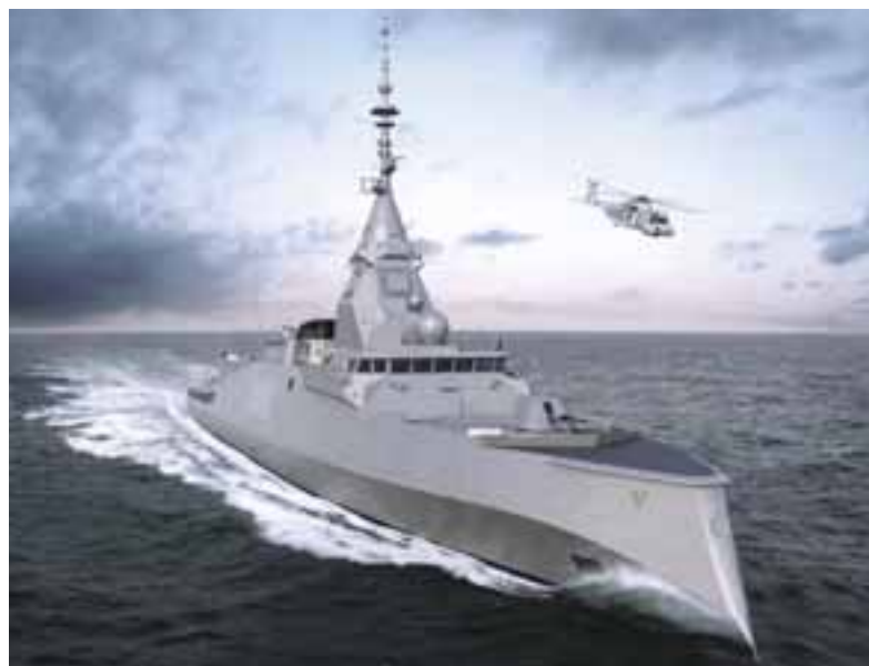
Γαλλική φρεγάτα Belharra. Η Ελλάδα προμηθεύτηκε 3.

Κι εδώ τίθεται ένα λογικό ερώτημα: Αν κινδυνεύουμε ενώ συμμετέχουμε σε αυτήν τη «συμμαχία», κάτι που