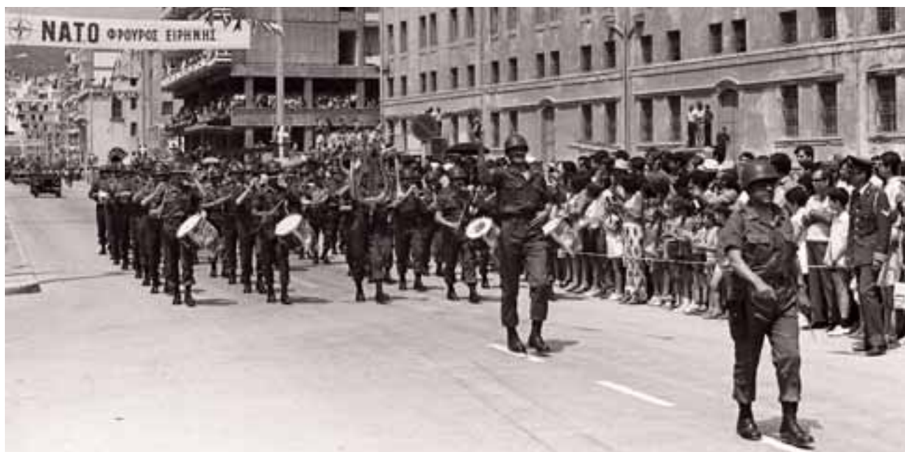
Στρατιωτική παρέλαση στο πλαίσιο της άσκησης του NATO Alexander Express στη Β. Ελλάδα (15 Ιουνίου - 5 Ιουλίου 1973).

Μέσω των ευρωατλαντικών βάσεων και υποδομών, που αναβαθμίζονται περαιτέρω με τη νέα Ελληνοαμερικανική Συμφωνία για τις Βάσεις την οποία θα φέρει η κυβέρνηση για επικύρωση στη Βουλή στο επόμενο διάστημα, η Ελλάδα έχει μετατραπεί σε ιμπεριαλιστικό ορμητήριο πολέμων, με το λαό μας να στοχοποιείται. Η ελληνική κυβέρνηση, συνεχίζοντας στα βήματα του ΣΥΡΙΖΑ, αναλαμβάνει για λογαριασμό των ΗΠΑ μεγαλύτερες δεσμεύσεις με την επέκταση των ήδη υπάρχουσών βάσεων και δημιουργία νέων, πρόσθετων υποδομών. Ο ΣΥΡΙΖΑ επιδοκιμάζει