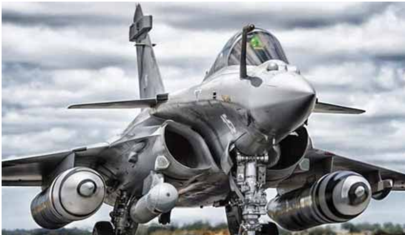
Πολεμικό αεροσκάφος τύπου Rafale. Η Ελλάδα προμηθεύτηκε 24.

Δ ιαχρονική θέση όλων των ελληνικών κυβερνήσεων, η οποία εκφράζει τις στοχεύσεις της αστικής τάξης, είναι ότι η ένταξη και η βαθύτερη ενσωμάτωση της Ελλάδας στο NATO και στην Ευρωπαϊκή Ένωση, η διατήρηση στενών σχέσεων με τις ΗΠΑ και η παρουσία και η δράση των αμερικανικών βάσεων στο ελληνικό έδαφος, αποτελούν παράγοντες διασφάλισης την ακεραιότητας και της ευημερίας της χώρας αλλά και της ειρήνης στην περιοχή.