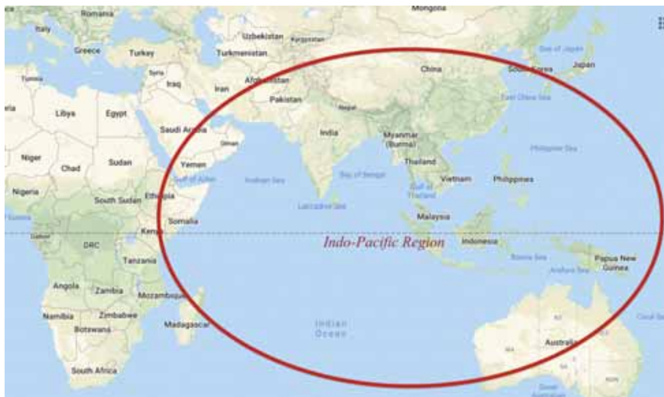
Η περιοχή του Ινδικού και Ειρηνικού στο χάρτη.

Στο φόντο του σφοδρού ανταγωνισμού τους με την Κίνα και τη Ρωσία, οι ΗΠΑ προσπαθούν να διατηρήσουν τη διεθνή πρωτοκαθεδρία τους και τον 21ο αιώνα και σε αυτή την κατεύθυνση επιταχύνουν τις προσπάθειες για την ενίσχυση παλιότερων και τη δημιουργία νέων οικονομικών και στρατιωτικών συμμαχιών στην περιοχή του Ινδικού και του Ειρηνικού. Πρόκειται για μια στρατηγική περιοχή στην οποία παράγεται το 60% του παγκόσμιου ΑΕΠ, ζουν τα δύο τρίτα του παγκόσμιου πληθυσμού και στο έδαφός της βρίσκονται επτά από τις 20 πλουσιότερες χώρες του κόσμου (G20).