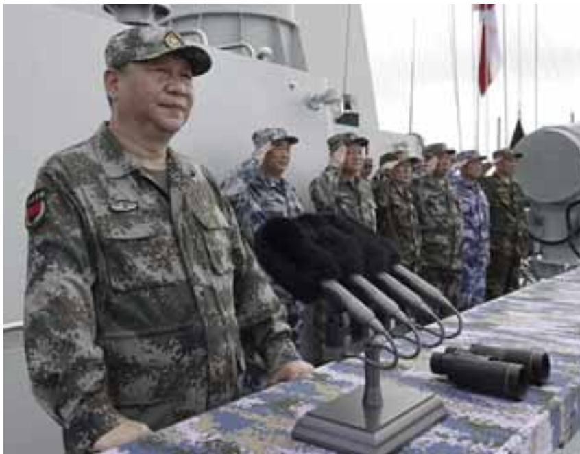
Ο Κινέζος πρόεδρος Σι Τζινπίνγκ με στρατιωτική αμφίεση.

δημοσιογράφος στην εφημερίδα «Ριζοσπάστης»